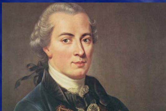
Великий философ Иммануил Кант (1724-1804),